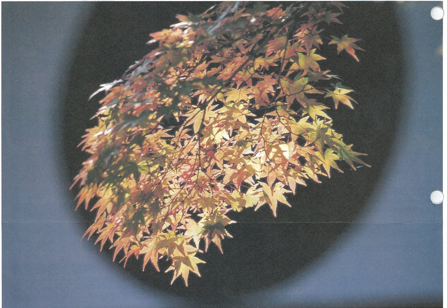
▲「紅葉」(撮影地:京都/光明寺)